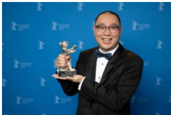
il regista cinese Huo Meng

L'Orso d'argento al migliore regista è andato al cinese Huo Meng per Living The Land , mentre il premio per la miglior sceneggiatura è andato al film Kontinental '25 del rumeno Radu Jude, già vincitore dell'Orso d'oro nel 2021. Provocatoria la dedica rivolta da Jude alla memoria di Luis Bunuel, con un commento sulle elezioni politiche (in svolgimento il 23 febbraio) nel quale ha espresso la speranza che il prossimo festival non venga dedicato alla regista Leni Riefenstahl, sostenitrice del regime nazionalsocialista tedesco durante la seconda guerra mondiale.