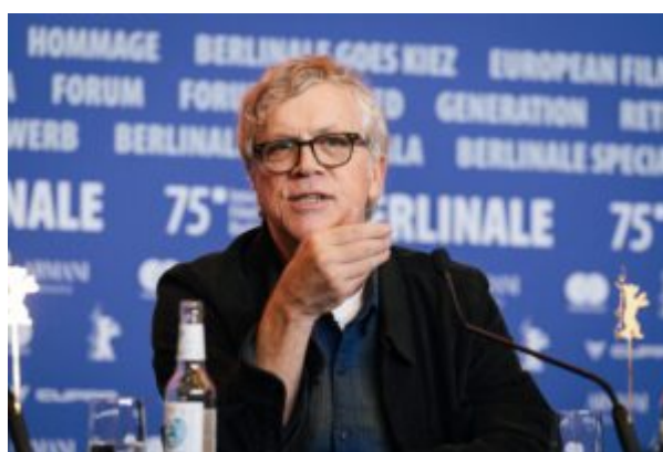
Il presidente della giuria, Todd Haynes